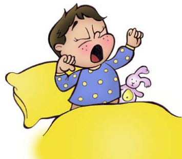
Se réveiller le matin