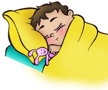
Dormir la nuit